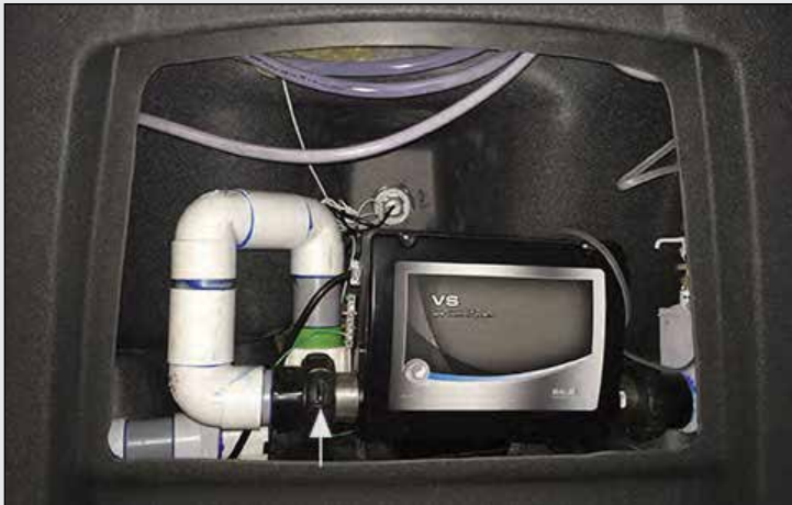
FIGURE 1.2a : HEATER UNION; LOOSEN UP TO BLEED AIR