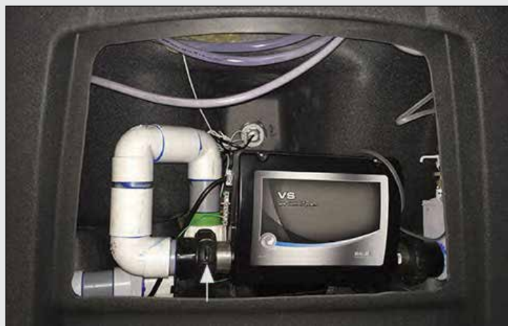
FIGURE 1.2a : BAGUE DU CHAUFFE-EAU; DESSERREZ POUR LAISSER S'ÉCHAPPER L'AIR