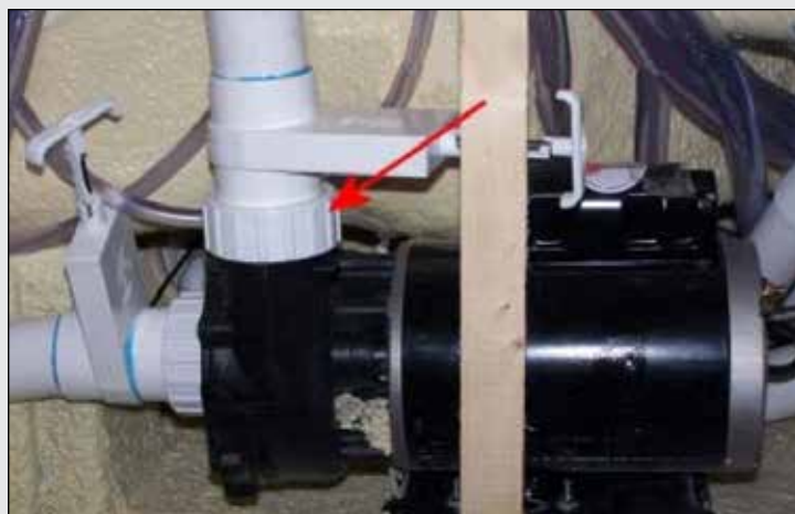
FIGURE 1.2b : BAGUE DE POMPE; DESSERREZ POUR LAISSER S'ÉCHAPPER L'AIR