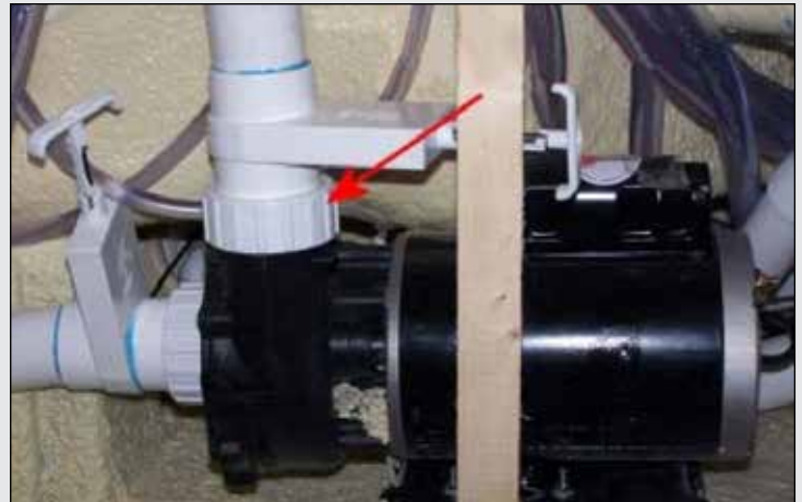
FIGURE 1.2b : PUMP UNION; LOOSEN UP TO BLEED AIR